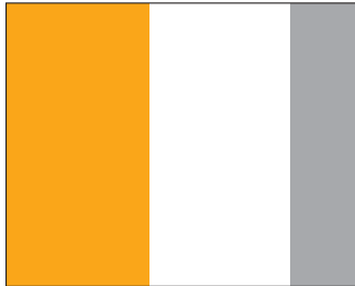
1/2 Seite (108,5 x 172 mm; B x H)